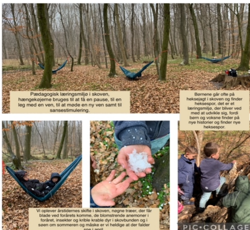
PicCollage af læringsmiljøer i skoven